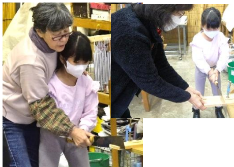
のこぎりの使い方から学んで