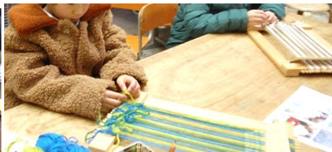
織機に結びつけて