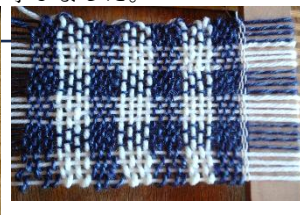
登場人物の着ている青い格子縞