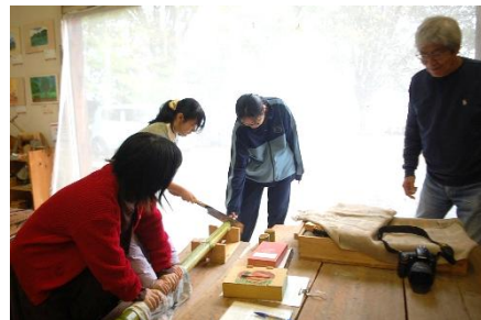
糸結びも教え合い