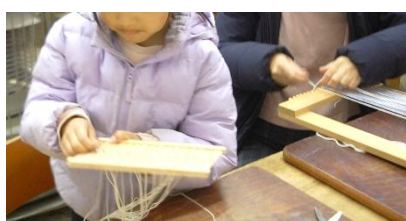
綜糸に糸を通して

織物を経験したことがある参加者は、自分で好きな色の経糸を選んでかけて、綾織りや模様織に挑戦。初心者にはたて糸をかけておき畳織をしました。幼児からおとなまで楽しくそれぞれが工夫して取り組み美しくいねいに織上がりました。